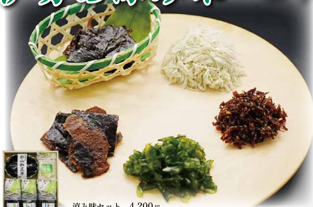
涼み味セット 4,200円 新山椒昆布、純白とろろ、生姜昆布、しそわかめ、ちりめん昆布 答志島 (木箱)