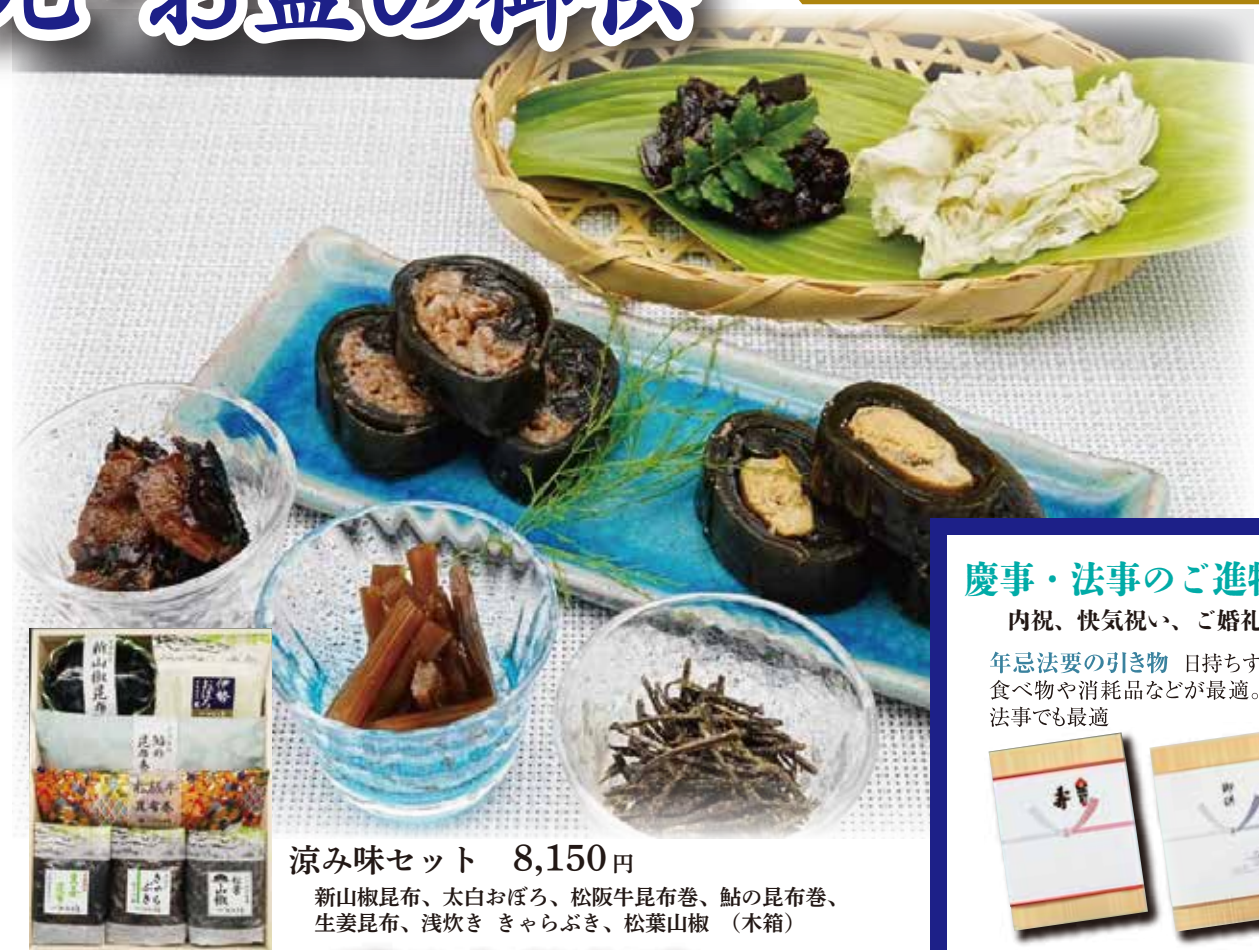
涼み味セット 8,150円 新山椒昆布、太白おぼろ、松阪牛昆布巻、鮎の昆布巻、生姜昆布、浅炊き きらぶき、松葉山椒 (木箱)