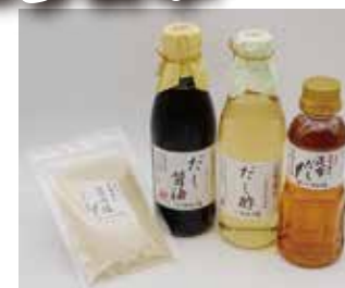
旨み塩 500円 だし酢 700円 だし醤油 800円 昆布だし 600円