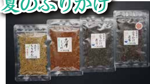
浅炊き ちりめん ふりかけ昆布 志摩しぐれ ふりかけ昆布 梅汐 各 500円