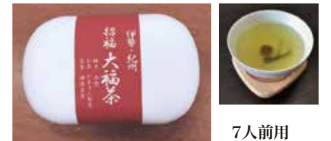
お正月用お年賀に 7人前用 1,500円