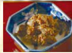
松阪牛しぐれ煮 1,600円