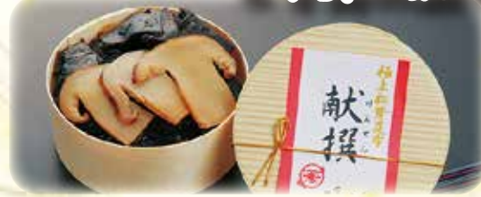
極上松茸昆布「献撰」 1,100円