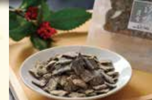
汐吹昆布 小切 800円