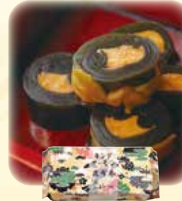
キングサーモン昆布巻 1,400円